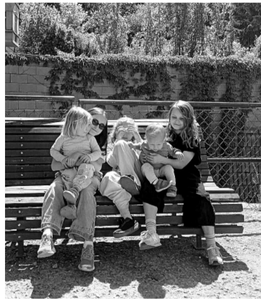
Dámy holky při neméně důležitých aktivitách.