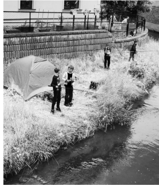
Páni kluci při důležitých aktivitách.