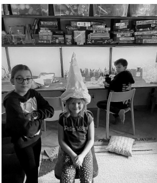
Když venku prší, výtvarná dílna přijde vhod.

Simča: Jelikož jsme se k vedení klubu přihlásily před letními prázdninami, tak jsme měly dost času si prostor dle sebe upravit. Od obce jsme měly volnou ruku a klub vedeme jenom my dvě, takže cokoli nás napadne, můžeme zrealizovat. Měly jsme čas si prostor udělat takový, abychom se v něm cítily dobře. V září do prostoru přišly děti a oživilo ho. Hned první týden většinu nábytku přestavěly, ale za to jsme byly rády. Víc se to hodilo k činnostem a aktivitám, které tu s námi chtěly dělat. Častokrát úpravy dětí byly lepší než ty, které napadly nás dvě.