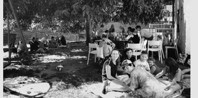
Prostory Klubíku naplněné k prasknutí (rok 2014).

V roce 2023 vyvstala otázka, jak dál. V rámci dotace z OPZ jsme upřednostnili seniory, jejichž život v obci by bez terénní pracovnice byl už dnes také jen těžko myslitelný a o dva programy najednou žádat nešlo. A tak si rodiče museli poradit sami. Po vzájemné dohodě se začali podílet na financování klubu formou měsíčních příspěvků a ty maminky, které byly právě na rodičovské dovolené, se střídaly v pozici vychovatelek. Přes počáteční obavy tento model funguje do dnes a Maria a Simča jsou dalšími v dlouhé řadě maminek, které v Klubíku děti nejen hliďají, ale nabízejí jim skvělý program a volnočasové aktivity. A o tom, že to dělají dobře, svědčí mimo jiné tři naplněné turnusy prázdninových příměstských táborů.