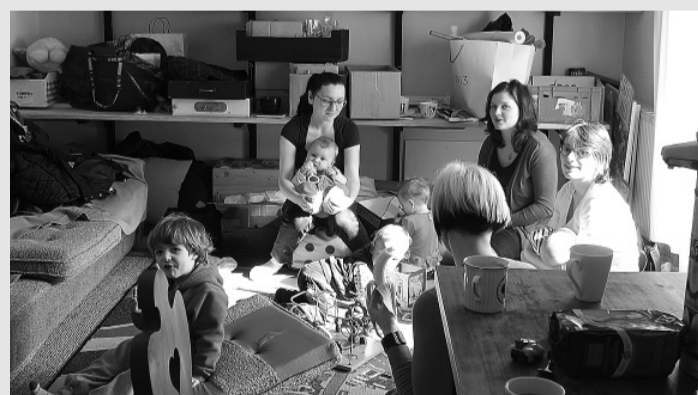
Klubík 2016 ve verzi Budánek, aneb útočiště novopečených maminek.