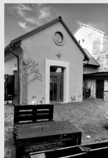
Domeček se dětem otevřel později.

(OPZ) se od roku 2016 podařilo klub pod názvem Děti in akci finančně podpořit. Mohli jsme tak nabídnout rodičům každodenní odpolední program pro děti, které se již nevešly do družiny, a zároveň zaměstnat několik maminek, které o děti pečovaly. Klub tak pod vedením Zuzky, která se mezitím stala dvojnásobnou maminkou, fungoval až do prosince roku 2022. Mezi tím se rozšířil o další bývalý