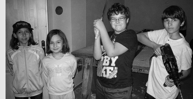
Ať se děti sami podílí na své klubovně (rok 2013).