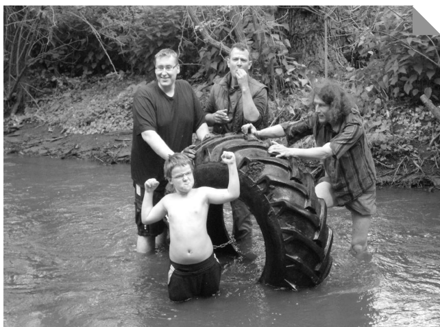
Více než hodinu trvalo skupině vytrvalců vyprošťování pneumatiky zanesené letitými nánošy bahna

Cestička Pod Sady se po svém znovuvotevření stala oblíbenou trasou mnoha obyvatel obce. Kromě toho, že se po ní můžeme vyhnout automobilovému provozu a dojít tak bez obav a bezpečně do centra Zákolan, je procházka podél potoka zároveň velmi příjemným zážitkem. Jedinou vadou na kráse byly donedávna naplavené odpadky, větve a části stromů na březích potoka. Když odpadky postupně zmizely v bujném porostu, rozhodli se ti, kdo cestu využívají pravidelně, potok vyčistit. Na doporučení našich myslivců počkali na dobu, kdy již nehnízdí vodní ptactvo a také se trochu oteplí a v sobotu 28. května se sešli, aby se v dobré náladě pustili do práce. Zatímco sběr odpadků se věnovaly především ženy, muži se neváhali ponořit do vod potoka a kromě větví a spadlých stromů vyprostili i pneumatiku, která potok hyzdila několik desítek let. V tomto nemalém úsilí byly nápomocny i děti a tak se z pracovního dne stala zábava. Protože naplavených odpadků je stále všude dost, budeme v čištění potoků pokračovat. Je vítán každý, kdo se přidá.