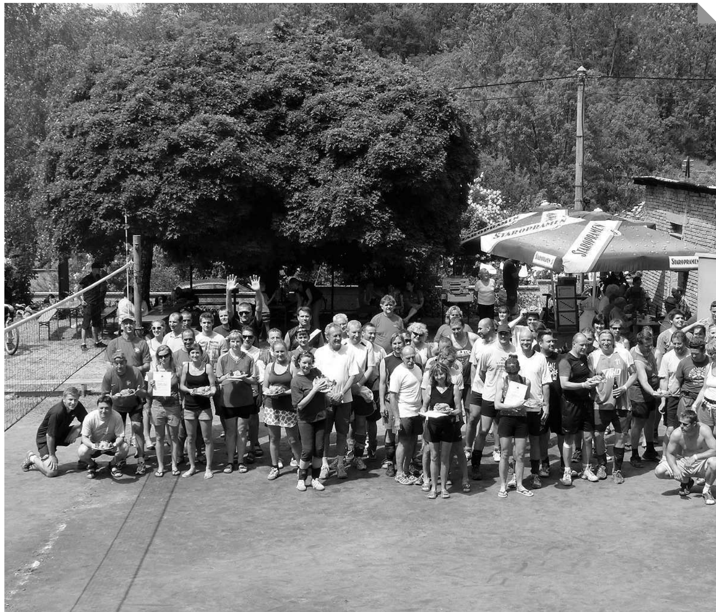
Účastníci volejbalového turnaje se na závěr shromáždili ke společné fotografii.