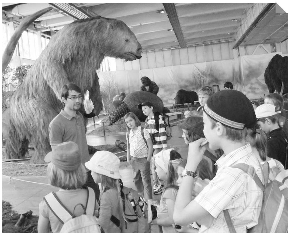
Na výstavě „Gigantů“ se děti vrátily do doby ledové.