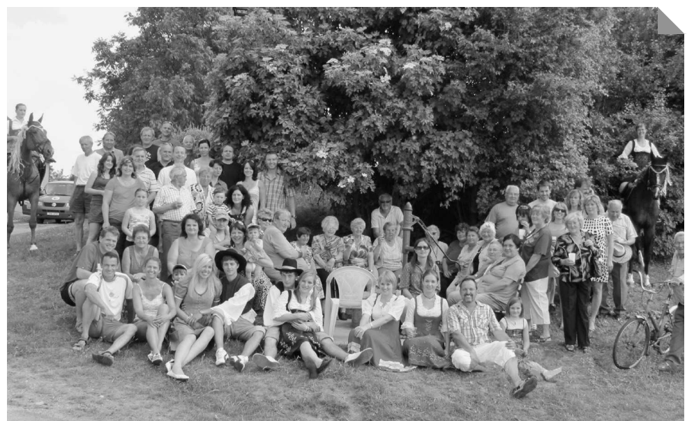
Letošní májová veselice se opravdu povedla.

Úderem 17. hodiny se pro všechny otevřela zahrada „U Libuše“, kde po půl hodině začala hrát hudba k tanci. Na zahradu měly zdarma přístup děti do patnácti let, tak jak je tomu zvykem všude, kde pravidelně a dlouhá léta pořádají májové. Rodiče tak nemuseli přemýšlet, kdo je jim pohlídk jejich ratolesti a zábava zároveň díky dětem dostala hezký rodinný a sousedský rozměr. Obsluha restaurace se činila, aby všichni měli co pít a dokonce jak slíbili, připravili i grilované klobásky. Byla to zkouška na příští léta, kdy doufáme rozšíří sortiment nabízených grilovaných specialit. Parket se brzo naplnil a děti, které na něm skotačily, vystřídali dospělí. Tombola, která se za-