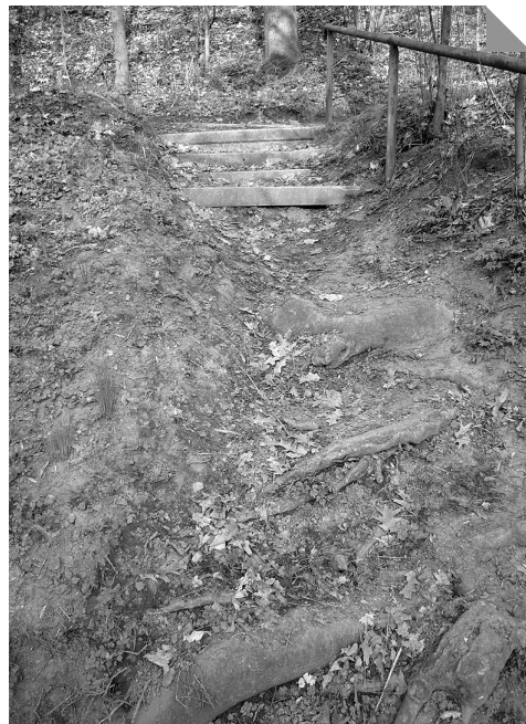
Schody ke splavu před a po realizaci projektu.

že U Splavu je pod viaduktem průchod vysoký pouze 1,6 m a napojení na cestu Pod Sady by bylo velmi obtížné, cesta je nepřístupná a dilem na soukromém pozemku. Úprava parku nemůže pokračovat cestou k hřišti už jenom proto, že podchod pod tratí bude Správa železniční cesty Českých drah zasypávat, protože se jeho klenba začíná rozpadat, na úpravu parku nám peníze stejně nikdo nedá, jeho část je na pozemku, který patří silnicím, socha Antonína Zápotockého také není v majetku obce, atd.