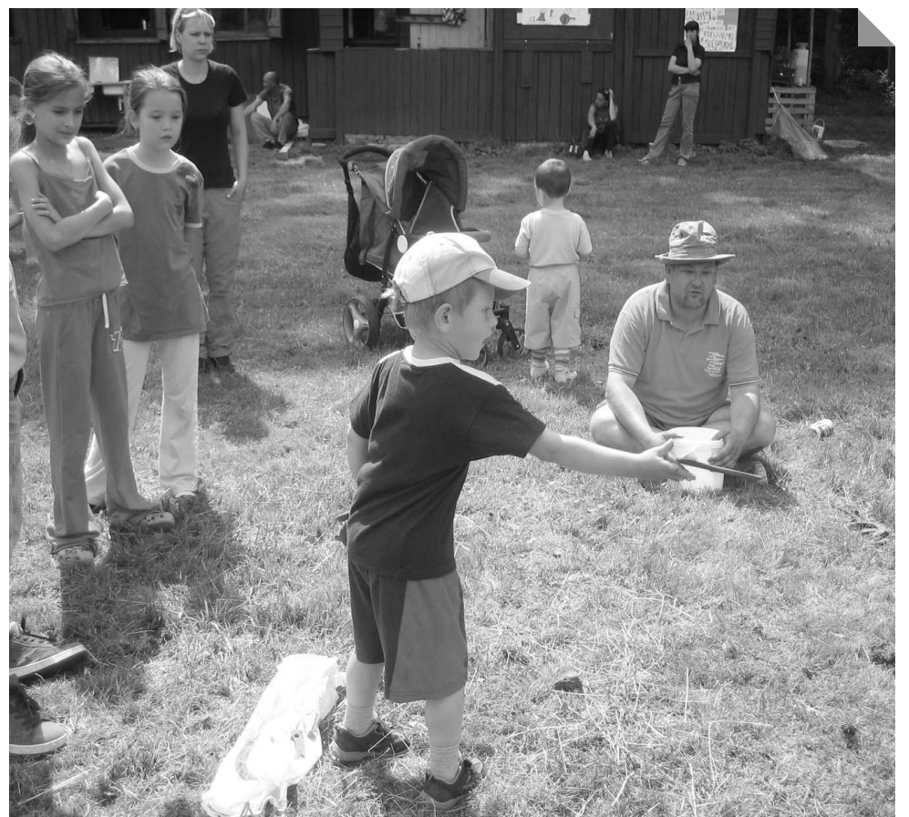
Pro malé i velké bylo v Podholí připraveno spousta her a soutěží.