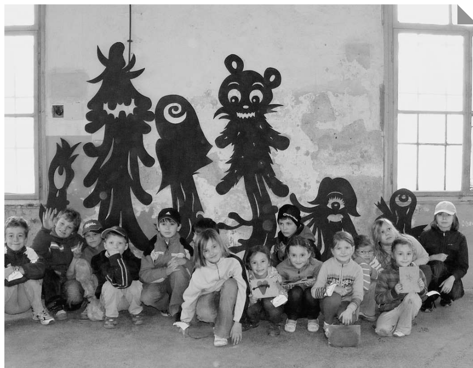
Některá z výtvarných děl studentů VŠUP jako by patřila do světa pohádek.