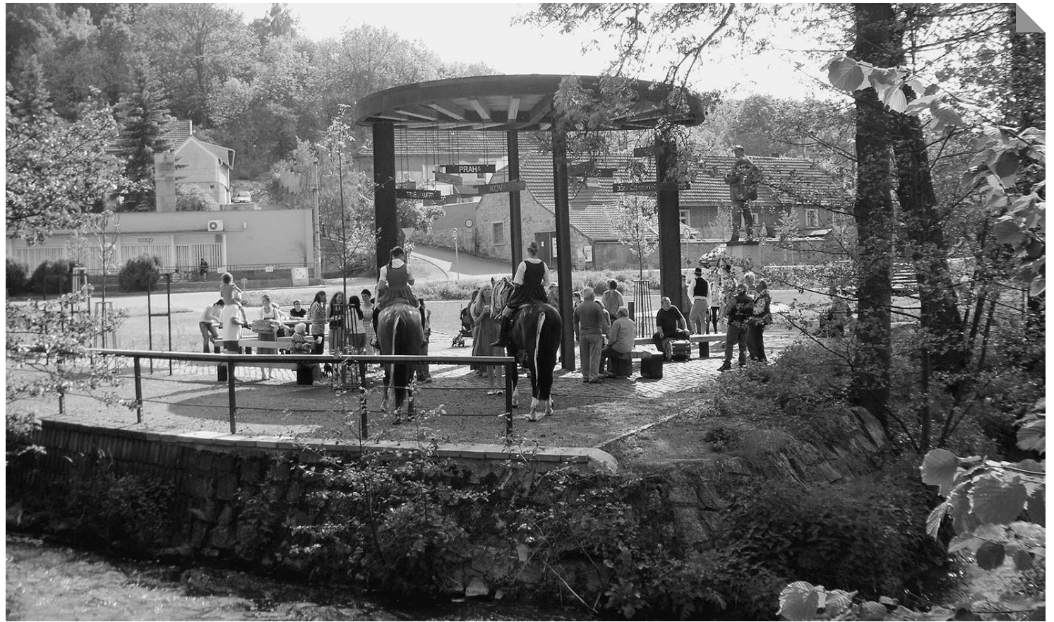
Letos poprvé mohli zákolanští prožít upoutávku na Májovou veselici v nově vybudovaném parku uprostřed obce. Posezení s živou muzikou a domácími koláčky si tady předposlední květnovou sobotu užili desítky místních i turistů