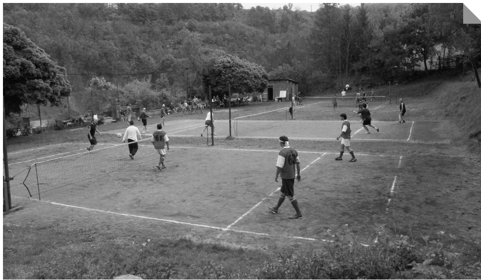
Nohejbalový turnaj byl jedním z prvních letošních sportovních klání na Sokolském hřišti v Zákolanech.

V sobotu 14. 5. proběhl v Zákolanech na malém hřišti již tradiční jarní nohejbalový turnaj. Počasí bylo ideální a nálada na jednotlivých hřištích skvělá, takže nic nebránilo sportovcům podávat skvělé výkony. Z původně přihlášených patnácti mužstev se zúčastnilo jedenáct týmů, což bohatě zajistilo klasicky dobrou úroveň celého nohejbalového klání.