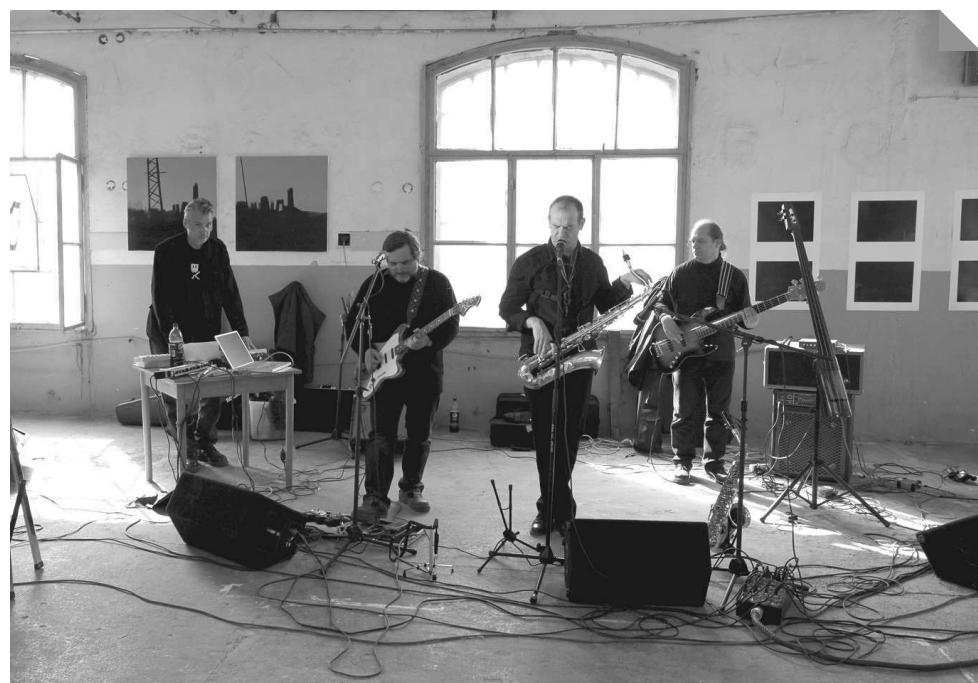
Hudební skupina DekadentFabrik

K tomuto kulturnímu a přírodnímu odkazu se přihlásila plenérová akce názvem Mařákovci 2011, která se odehrála jako součást letošního bienále Industriální stopy za podpory VŠUP Praha. V zájezdním hostinci už dávno neposkytují ubytování, ale díky starostce Zákolan a majiteli bývalé továrny na výrobu pian značky Dalibor měli umělci k dispozici patro tohoto zajímavého industriálního objektu, kde býval výstavní ateliér pro hotové nástroje. Místní kronikář poskytl dokonce GPS souřadnice míst, kde některá díla „mařákov-