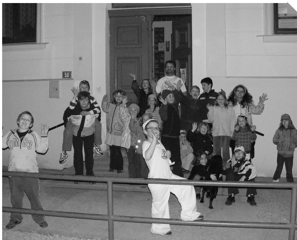
Noc s Andersenem patří mezi nejoblíbenější akce školy.