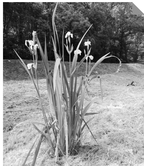
Kosatce vodní (Iris pseudacorus).

Tedy to vše mohlo znít jako bláznivá utopie. A mohli jsme najít řadu důvodů, proč se do takovýchto projektů nepouštět: Cesta Pod Sady zůstane nevyhovující například už jenom proto,