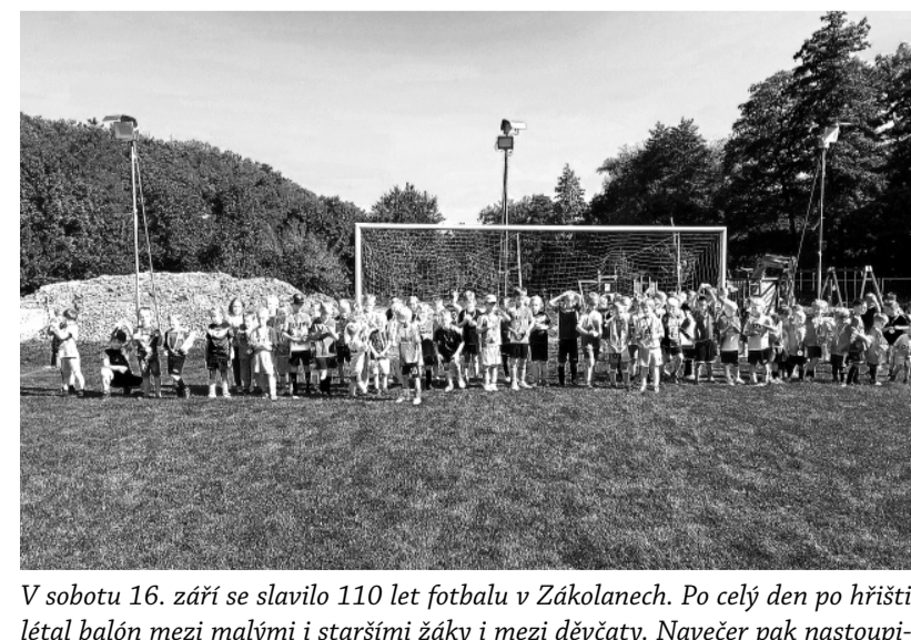
V sobotu 16. září se slavilo 110 let fotbalu v Zákolanech. Po celý den po hřišti létal balón mezi malými i staršími žáky i mezi děvčaty. Navečer pak nastoupili Masters dospělí do litého boje o soudek piva. K němu pak za tmy dotvářela nálada kapela Big Rock.