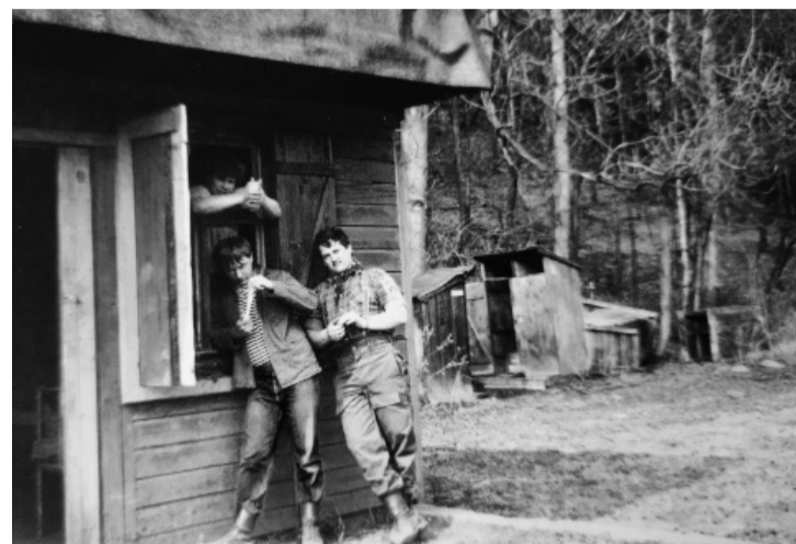
Na tábořišti v Podhohli v roce 1995.

Když jsme byli malí, tak se vždycky našli lidé, kteří to tu pro nás dávali dohromady. Abychom mohli v létě něco zažít. Proč by dneska děti nemohly mít stejnou šanci? Tady není elektřina, je tu mizerný signál, děti můžou spát ve stanech, sami si vařit na ohni, hrát venkovní hry, courat po lese. Je to něco jiného než doma. Něco, na co se dá vzpomínat. Takže nechci mít tábořiště pro sebe a naopak doufám, že si ho užijí i děti našich dětí.