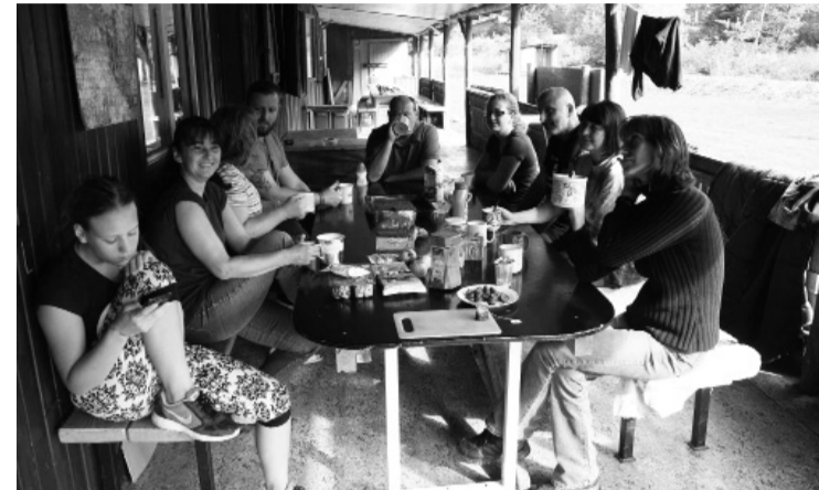
Posezení v Podhohli v roce 2016.