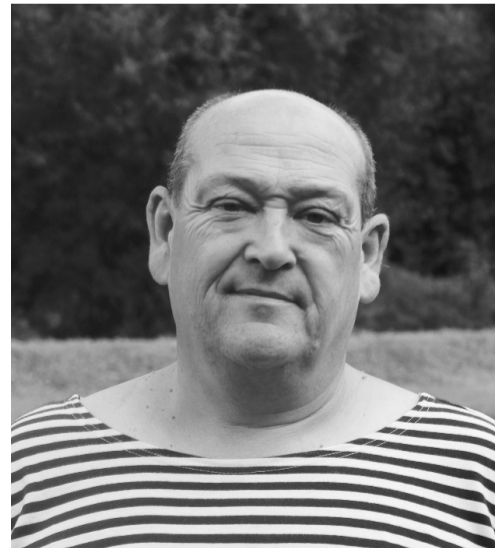
Má smysl dnes uvažovat o rekonstrukci koupaliště?

Po těch velkých povodních, což bylo tuším někdy v roce 2003/2004. To byl bazén naposledy napuštěný a my jsme se v něm koupali. Pak ho někdo, nevím kdo, napustil na zimu a zdi roztrhal mráz. Když se vysypala první stěna, ještě jsme ji spravili. Ale když se vysypala i protější stěna, už nebyla síla bazén opravovat.