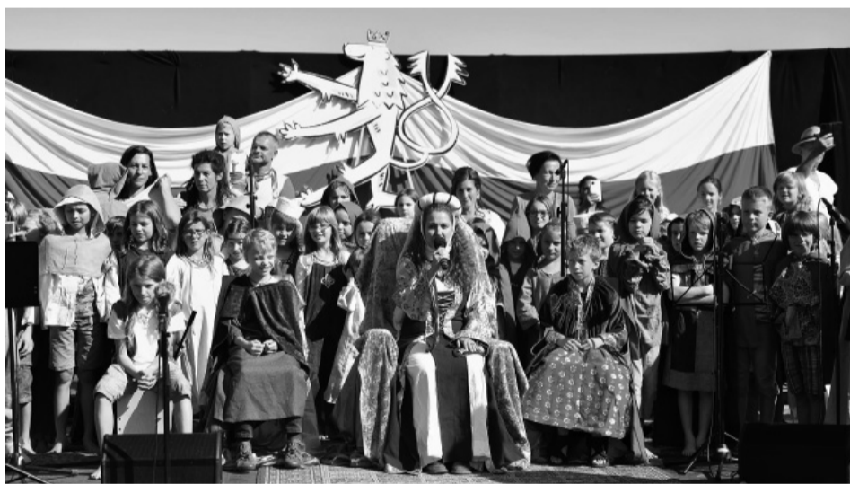
Vystoupení dětí na Svatováclavských slavnostech.