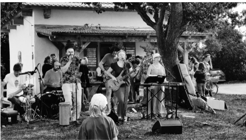
Zahájení školního roku na Budči.