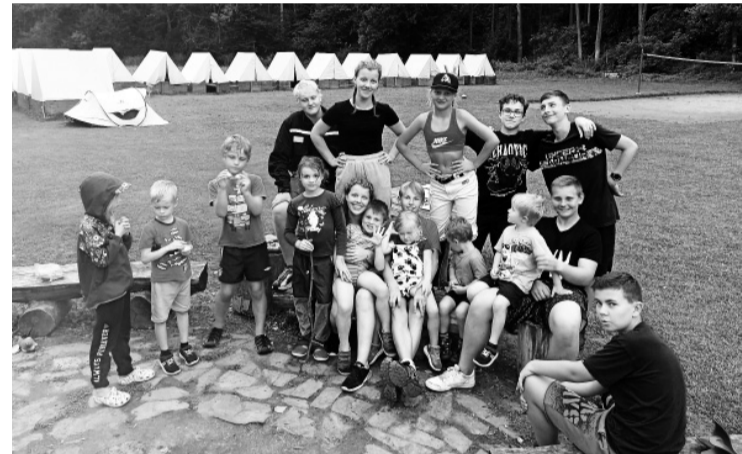
Soustředění mladých hasičů v Podhohli v srpnu 2023.