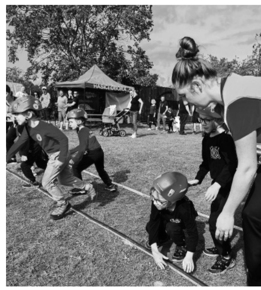
Naši dorůstající hasiči bojují v Podřípské hasičské lize na závodech v Oboře 3. září.