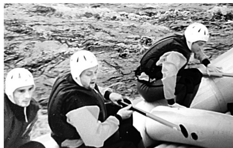
Na divoké řece s přáteli.