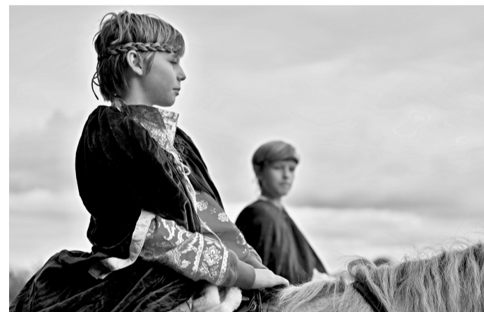
V září oslavujeme na Budči sv. Václava.

Děti dále navštívily divadelní představení Zlatoláška v divadle Lampion v Kladně, kino ve Slaném a také ochutnaly