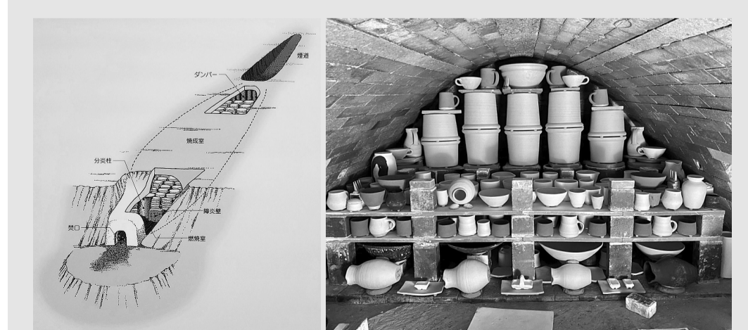
Jeskynní pec ve starém Japonsku.

Nová keramická pec v Zákolanech se řadí k unikátům vyzdívkářského a pecařského řemesla a nemalým dílem rozšiřuje řady technických zajímavostí obce.