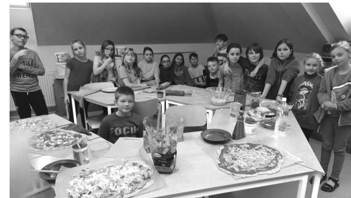
Pečení pizzy z vlastnoručně vypěstovaného a umletého obilí.

pizzu ze školy mouky, kterou pro ně připravili a upekli starší kamarádi ze školy v rámci projektu „Pole“. Ve dnech 4. - 15. 11. 2024 se všechny třídy základní školy zapojily do kreativního projektu „rezidence umělců“. Děti se věnovaly problematice lidských práv a jejich uplatňování v třídním kolektivu. S ohledem na načasování projektu se žáci zamýšleli nad svátkem a tradicemi v podzimním období (28. 10. Den vzniku samostatného československého státu, 2. 11. Památka zesnulých, 11. 11. sv. Martin a 17. 11. Den boje za svobodu a demokracii).