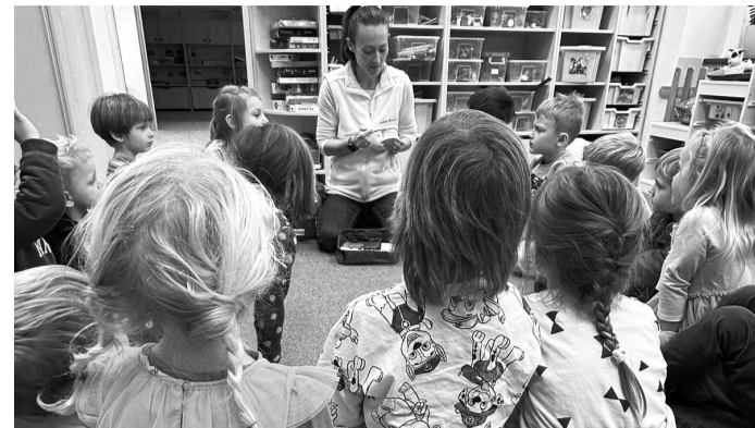
Lekce první pomoci ve škole.

Čas v mateřské a základní škole v rámci adventní atmosféry plyne rychle a krásně. Děti se seznamují s různými vánočními zvyky, zpívají, tvoří pro sebe i své blízké drobné dárky, připravují se na vystoupení.