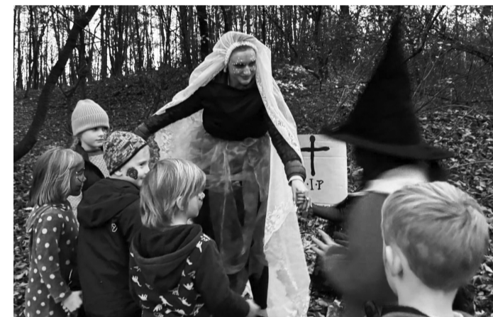
V listopadu tančíme s mrtvou nevěstou na Dušičkách.

První třída pracovala s představou tři zemí. Děti si vybraly Čínu, Španělsko a Československo. Žáci okreslovali postavy