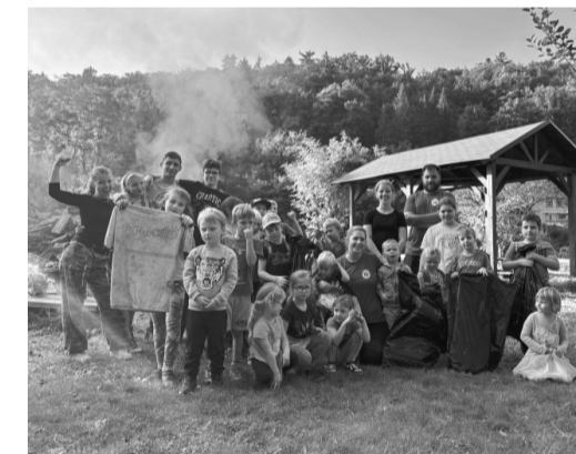
Mladí hasiči možná 20. září při akci „Uklidíme Česko“ neuklidili celé Česko, ale Zákolany tedy rozhodně.