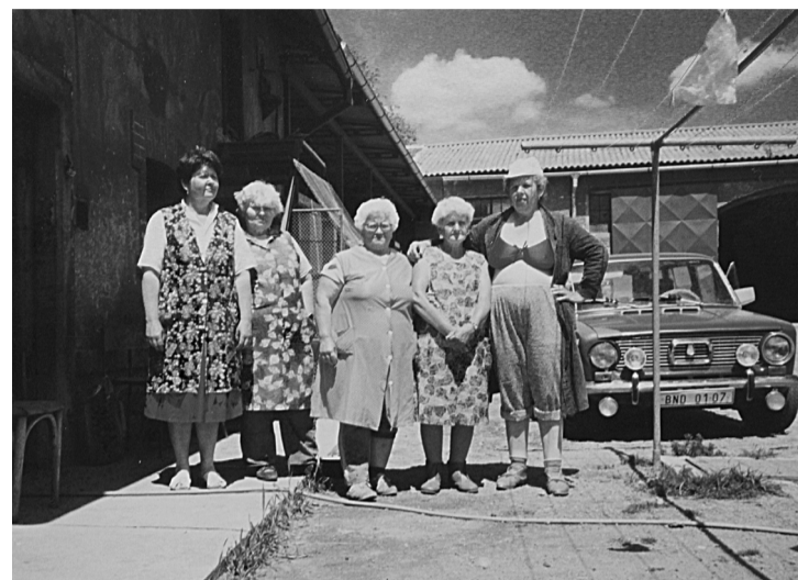
Úderná brigáda z kraje devadesátých let.