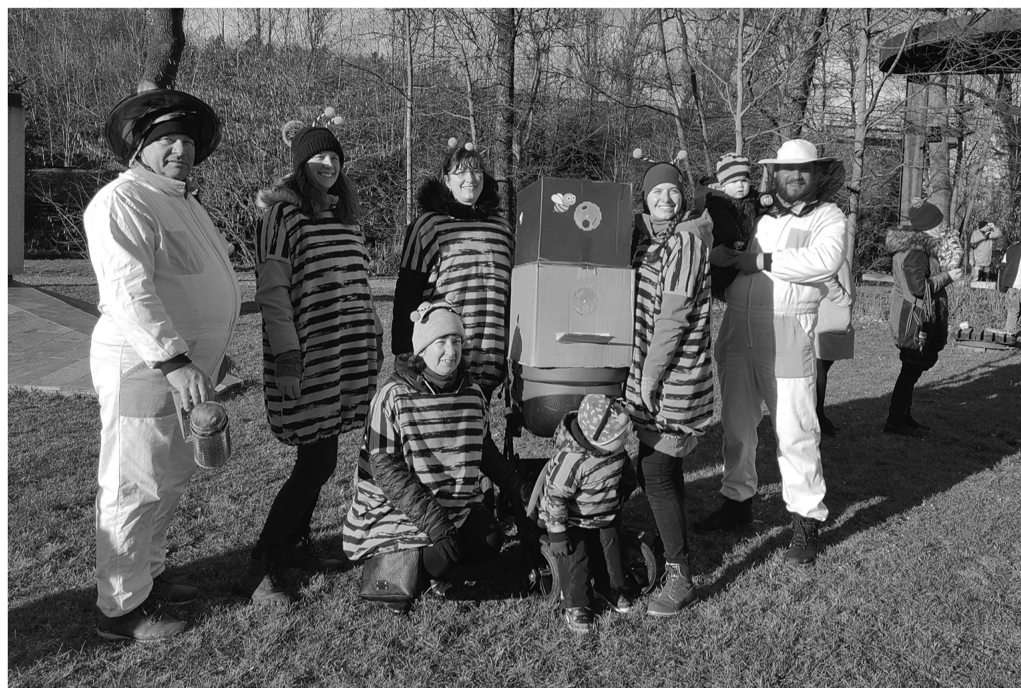
Devátý zákolanský masopust se trefil do škvíry mezi mračna a dešť tak šikovně, že nezmožily ani věčky (vítězná skupinová maska), ani pár koní vozící děti.