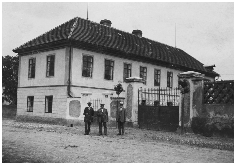
Statek č.p. 2 za Rakouska-Uherska.

ale kde vezmete tolik vody? Sady nad Trněným Újezdem berou vodu z vrtů, tam voda je. Tady ne. Dřív jsme brávali vodu z potoku, tam už taky není. Tak bereme vodu, kde se dá, někdy musíme i z kohoutku, když nutně potřebujeme na postřiky.