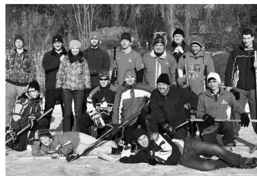
Jestě v roce 2012 se dalo venku bruslit.

Částečně jsem na to odpověděl v předchozích dvou otázkách. Myslím, že se svou rodinou žiji na krásném místě přímo nabytém historií, tradicemi, malebným krajem. Díky