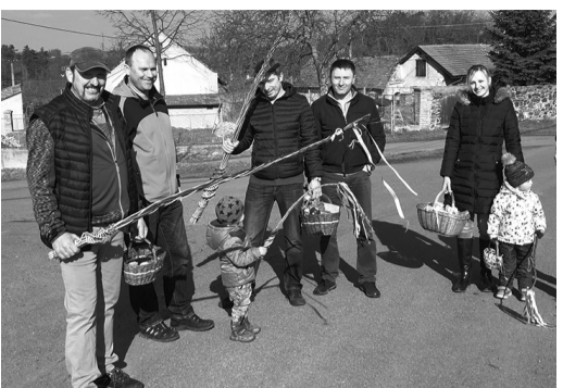
Velikonoce 2018 na Trněném Újezdu.

To by bylo na samostatný rozhovor. Jsou to velké, větší, či menší malé střípky, ze kterých jsme složili mozaiku naší obce. A opravdu stojí za obdiv, co se tu dokázalo. Ono na to dobré a hezké se snadno zvyká,