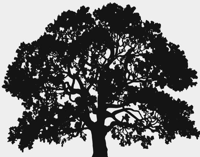
Jestě víc, člověk už tolik ne. Když tento čas přijde, nezáleží jen na druhu stromu, ale také na místě, kde roste a zejména na rozsahu všech poškození, která se časem nashromáždila.

Máme-li štěstí a věnujeme-li malému stromku patřičnou péči, dočkáme se za několik desítek let jeho dospělosti, kdy začne plnit naše očekávání – vyroste do krásy, do síly, v období parného léta nám poskytne potřebnou úlevu, některé druhy nás občasnými svými plody. V takovém věku dělají stromy radost nejen nám, ale i mnohým živočichům, kterým poskytují domov a potravu. Bohužel, jak čas běží, strom stárne. Stará poškozená se změní v dutiny, sem tam odumře nebo se zlomí větev. Příroda se raduje