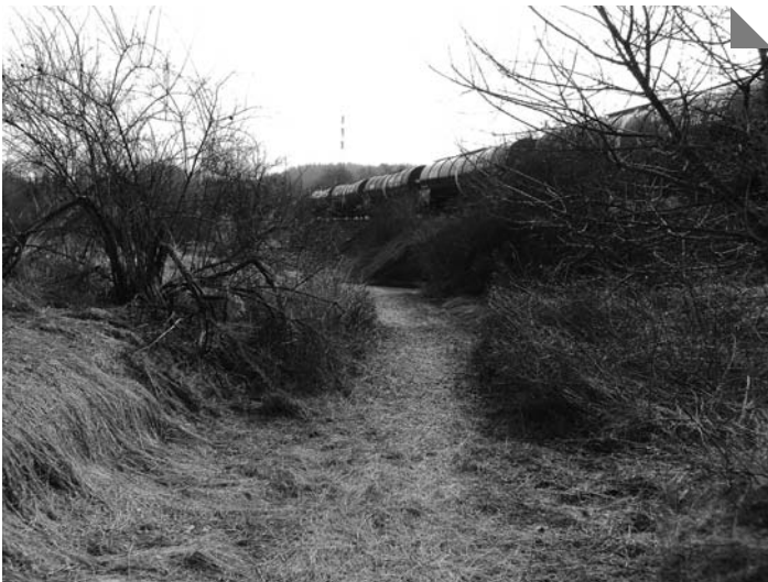
Obnovená cesta z Kovár na Okoř

Další důležitou novinkou je obnovení stezky pro pěší mezi Dřetovickým viaduktem a Kováry, které se v době uzávěrky tohoto čísla Budečských rozhledů dokončovalo. Pěšina začíná před viaduktem a prochází nejprve starým úvozem a pak podél pole. Cestička se dále zanořuje do malebných zákoutí údolní nivy a v Kovárech vyúsťuje před železničním přejezdem u cesty na Budeč. Tato pěšina je důležitá proto, že navazuje na cestu Pod Sady a umožňuje pěším dostat se ze Zákolan a z Kovár směrem na Okoř, Libochovičky i na Dřetovice mimo silnici a bez zbytečných převýšení. Podobně jako na cestě Pod Sady bude i na této stezce umístěna zábrana pro vjezd motorek a jezdců na koních.