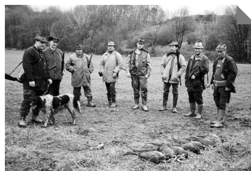
Výlož zvěře po leči na společném honě ■ Foto: Archiv BR

Význam myslivosti dodává také její několikasetletá tradice (obsahující mimo jiné také mysliveckou mluvu a zvyky). Každý si jistě vzpomene na nějaký lovecký hrad nebo zámek, na výtvarná, hudební či literární díla s tematikou myslivosti a zvěře. Myslivost se tak již dávno stala nedílnou součástí naší kultury.